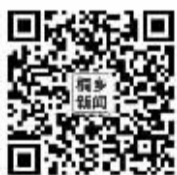
桐乡新闻，微视桐乡 关注有礼，参与有礼，互动有礼！

“这次活动，不仅让参观群众对人民币的历史和人民币的防伪特征有了新的认识，也更好地树立了市金融机构品牌形象，在群众心中形成了良好的口碑。”桐乡农行相关负责人表示。