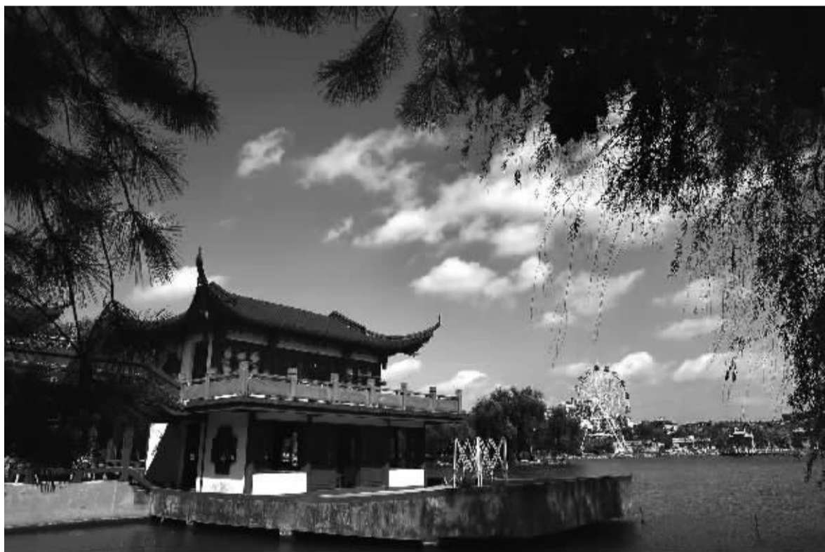
昨天，受副热带高压减退和台风外围影响，我市炎热感觉削弱，气温回落到高温线以下。让人惊喜的是，这两天蓝天白云唱起主角，城市各个角落都成了精美的明信片。