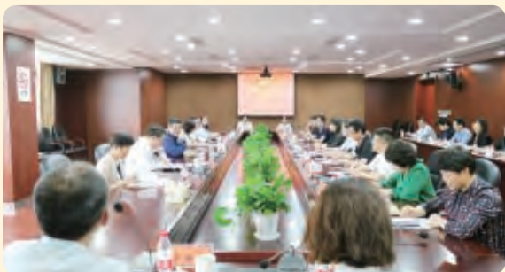
▲5月22日，浙江省副省长、民盟省委会主委成岳冲带队赴杭州调研。

编者按：为深入贯彻落实中共中央《关于加强中国特色社会主义参政党建设的意见》等三个文件精神，积极应对当前浙江民盟组织建设面临的新问题、新挑战，进一步聚焦组织建设中的突出问题和薄弱环节，剖析问题根源，寻求解决对策，民盟省委会自5月份开始开展组织建设专项调研。调研由省委会领导带队，通过发放调查问卷，走访基层、个别访谈、座谈研讨等形式，广泛听取广大盟员特别是各级组织领导班子成员、代表人士和年轻干部的意见建议，努力提出有针对性、操作性强的对策建议，为把浙江民盟建设成为政治坚定、组织坚实、履职有力、作风优良、制度健全的中国特色社会主义参政党地方组织提供重要参考。