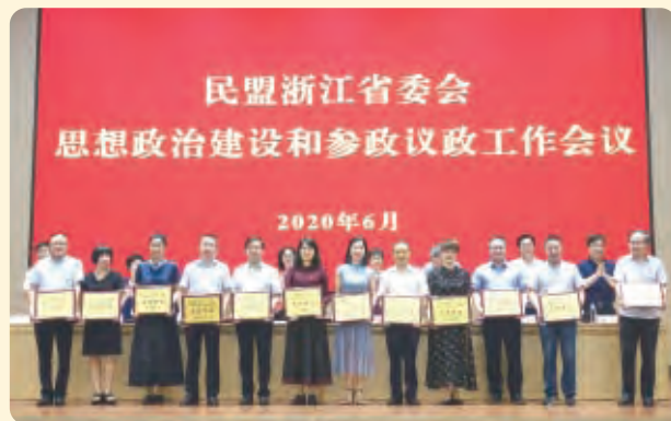
▲民盟省委会“不忘合作初心，继续携手前进”主题教育活动先进单位。