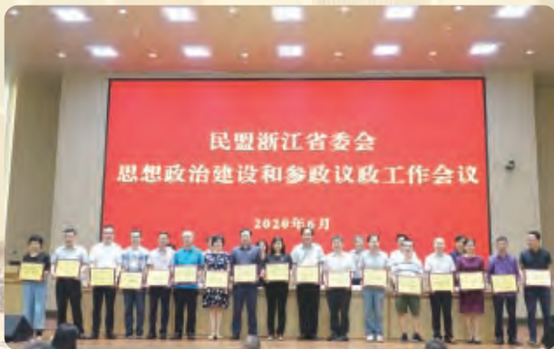
◀民盟省委会2019年度反映社情民意信息工作先进省直属基层组织