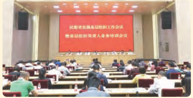
▲5月22日，民盟省直属基层组织工作会议暨基层组织负责人业务培训会议在杭州召开。