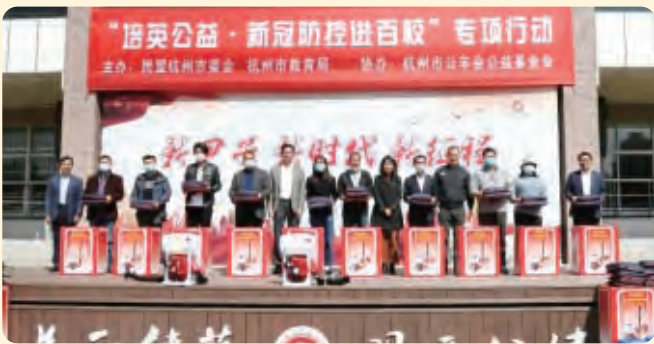
▲4月8日，民盟杭州市委会启动“培英公益·新冠防控进百校”专项行动。