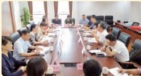
▲7月2日，民盟省委会副主委、宁波市副市长许亚南带队赴舟山调研。