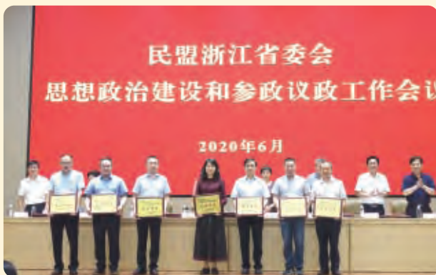
▲民盟省委会2019年度思想政治建设和宣传工作先进单位。