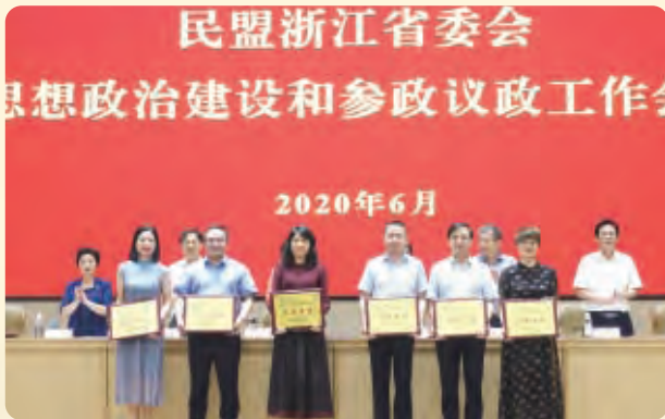
▲民盟省委会2019年度参政议政工作先进单位