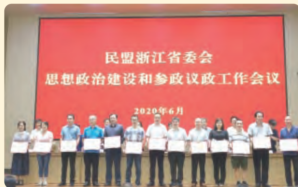
▲民盟省委会2019年度思想政治建设和宣传工作先进省直属基层组织。