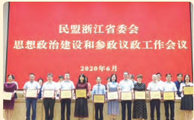
▲民盟省委会2019年度反映社情民意信息工作先进单位