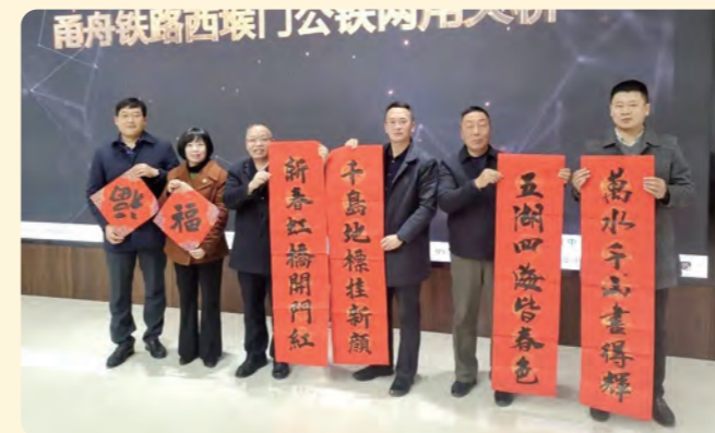
▲民盟舟山市委会赴中铁大桥局甬舟铁路指挥部开展界别视察调研和送春联活动，表达对项目建设工人的新春问候。