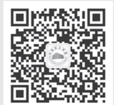
“中国民主同盟”微信公众号