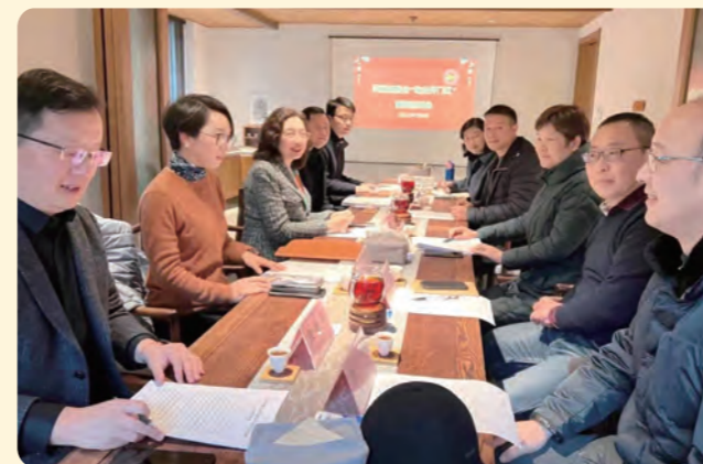
▲ 走访六言（杭州）文化艺术有限公司，召集浙江至控科技公司、新安硅谷研究院等部分盟员企业座谈。