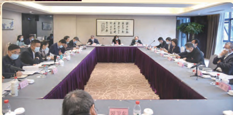
▶ 1月16日和1月18日，民盟界别组省政协委员分别热议省政协常委会工作报告、提案工作情况报告、政府工作报告和“两院”工作报告等。