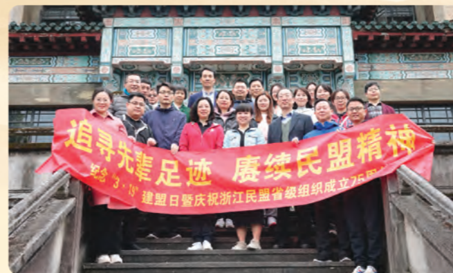
▲ 民盟省委会机关总支在职支部开展“追寻先辈足迹 赓续民盟精神”——纪念“3·19”建盟日暨浙江民盟省级组织成立75周年徒步定向打卡活动。