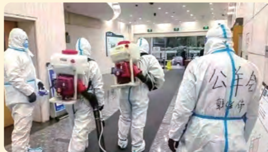
▲ 杭州 公羊会支部盟员