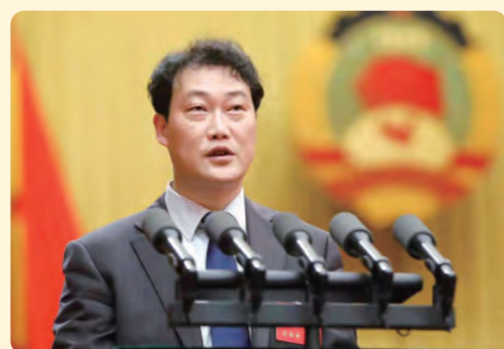
▲ 欧剑委员代表民盟界别组作题为《打通“堵点”消除“盲点”破解中长期失能老人医养护康“窘境”》的大会口头发言。