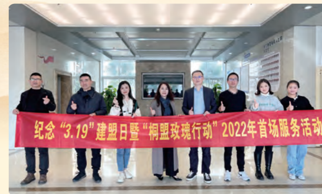
▲ 民盟桐乡市基层委员会举行纪念“3·19”建盟日暨“桐盟玫瑰行动”2022年首场服务启动仪式。