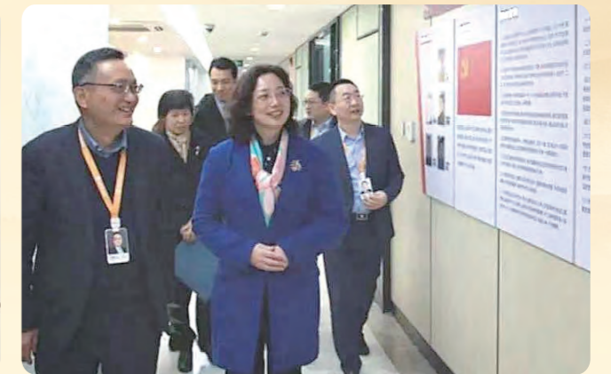
▲ 走访杭州新中大科技股份有限公司。