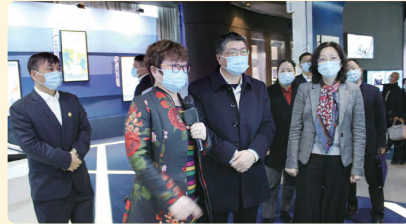
◀ 走访浙江盛洋科技股份有限公司开展“助企开门红”活动。