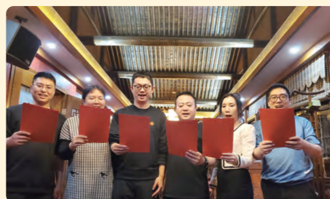
▲ 民盟台州市委会组织开展建盟日活动，进行诗歌朗诵，传承民盟精神。