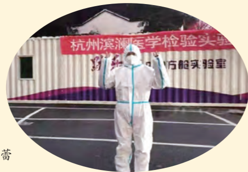
▶ 杭州盟员 赵蕾