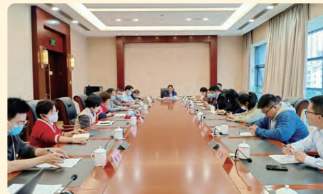
▲ 为纪念“3·19”建盟日，民盟金华市委举行“话初心·谈履职”主题座谈会。