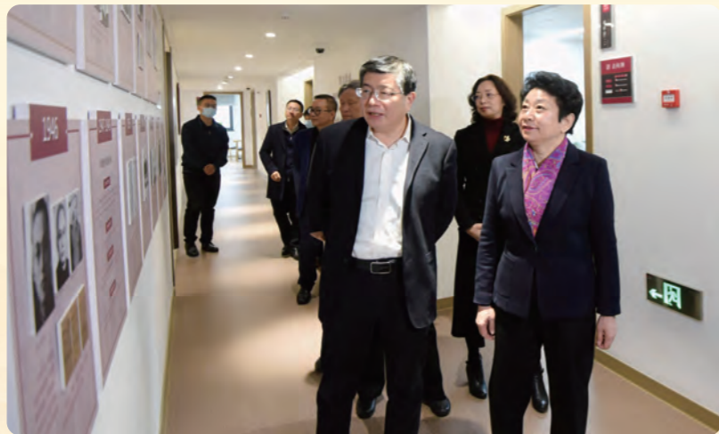
▶ 1月10日，省政协党组书记黄莉新走访省各民主党派工商联。