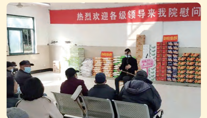
▲绍兴市民盟艺术团的文艺骨干赴麻风病院慰问，并带去精彩节目。