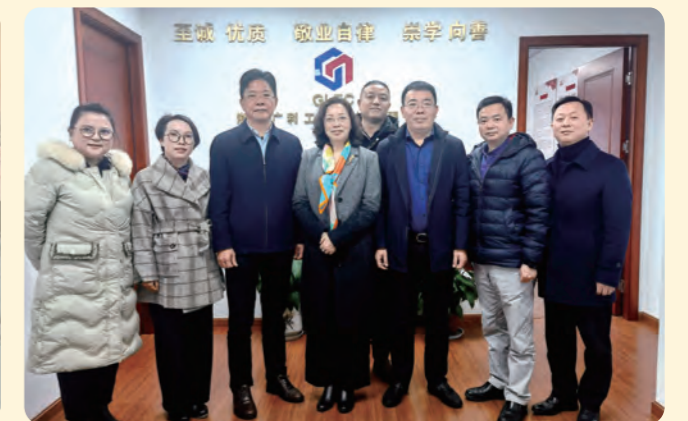
▲ 走访浙江广利工程咨询有限公司，与浙江耀厦控股集团有限公司、浙江鼎测地理信息技术有限公司等盟员企业座谈。