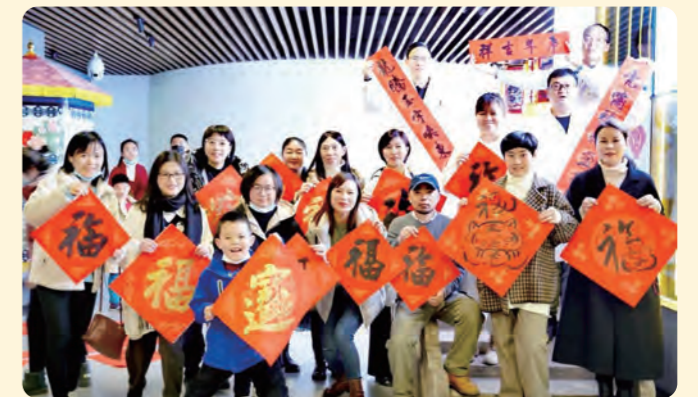
▲民盟省委会积极发挥文化主界别特色优势，组织书画艺术家们创作新春祝福。