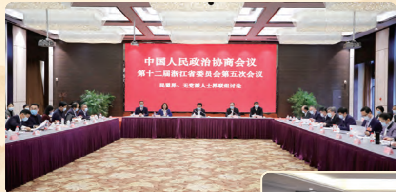
◀ 1月17日，省政府副省长高兴夫看望民盟、无党派人士界别委员并参加联组讨论。