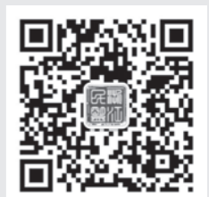
“浙江民盟”微信公众号