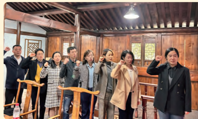
▲ 民盟柯桥区基层委员会组织开展“学先贤·悟初心”活动，重温入盟誓词，传承民盟精神。