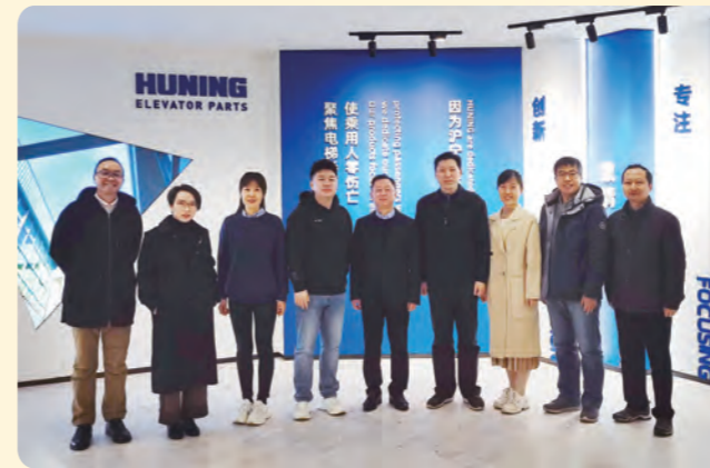
▲ 走访杭州沪宁电梯部件股份有限公司。