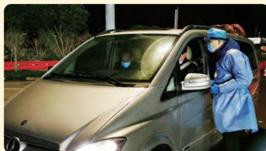
▲ 舟山盟员 钟舟杰