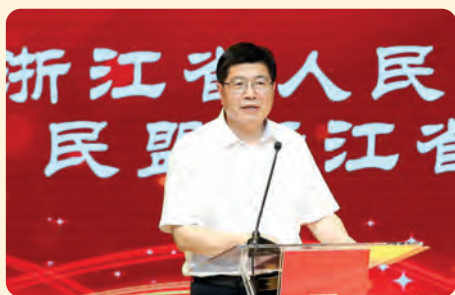
▲副省长、民盟省委会主委成岳冲讲话