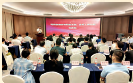
▲8月28日，民盟省直工委举办2019年新盟员培训班三年延长培训结业典礼。