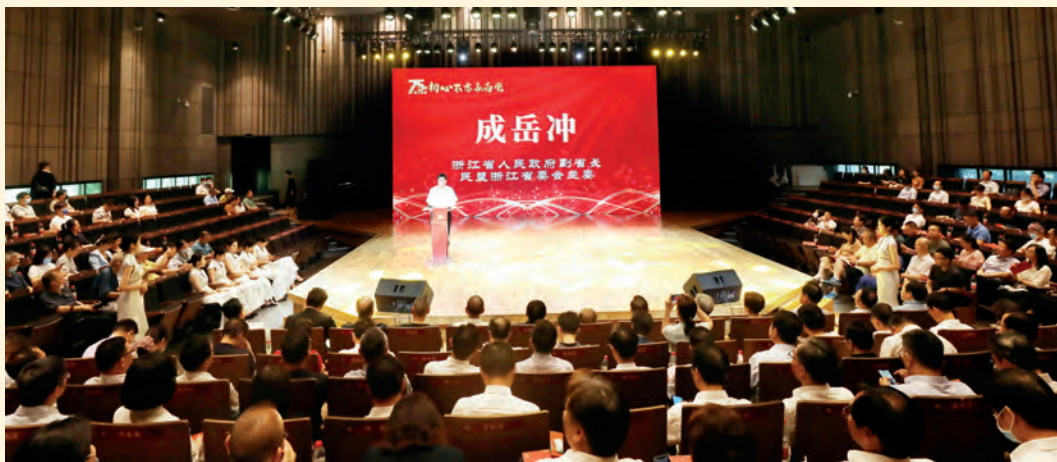
▲7月8日，民盟省委会举行“初心不忘永向党”——纪念民盟浙江省省级组织成立75周年大会。