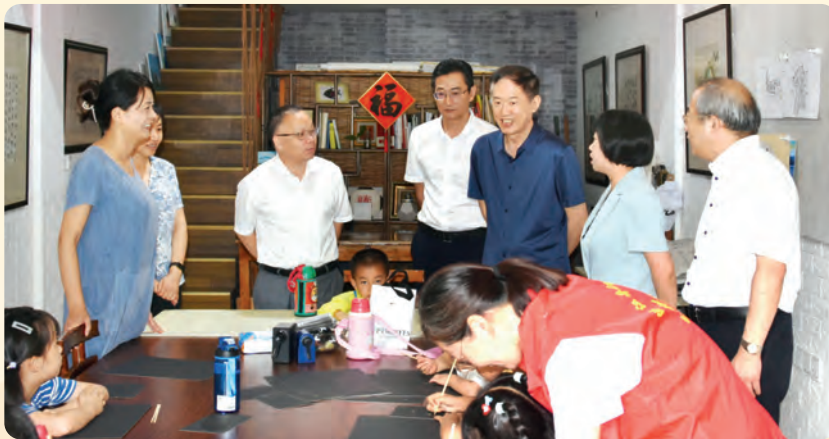
◀8月2日，民盟中央副主席徐辉率队赴舟山调研基层盟务工作和海岛高质量发展。