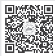
“中国民主同盟”微信公众号