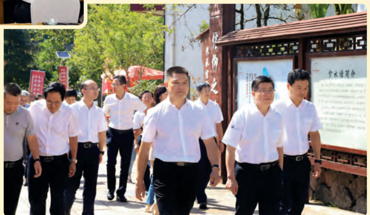
▶9月20日，民盟省委会赴义乌、浦江开展政治交接主题教育现场活动。