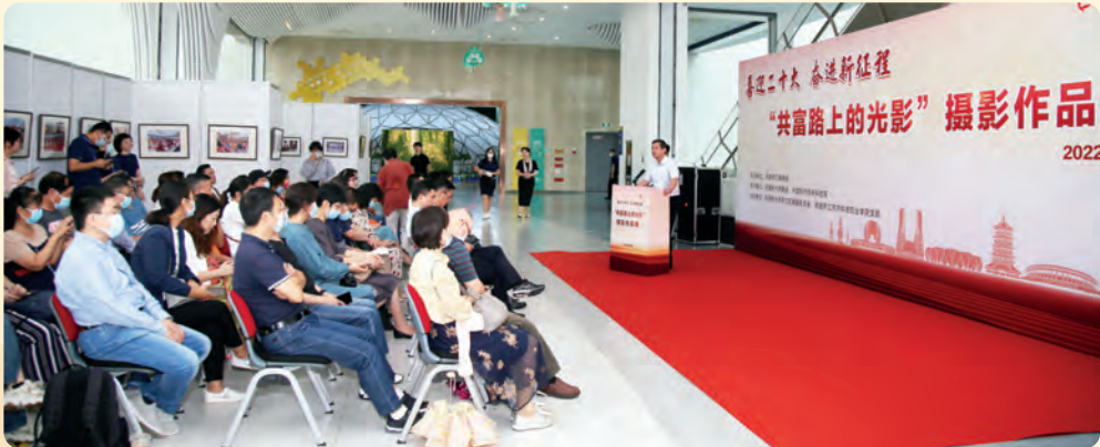
▲9月29日，民盟省委会“共富路上的光影”摄影作品展隆重开幕。