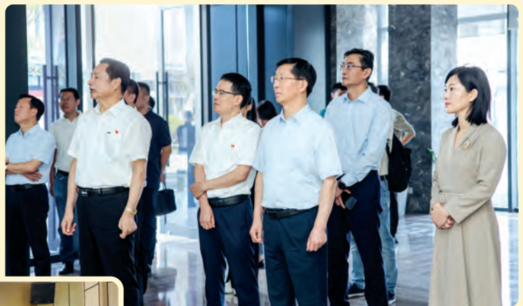
▶9月21日，民盟中央副主席曹卫星赴嘉兴开展“长三角率先实现高质量与绿色化协同发展”专题调研。