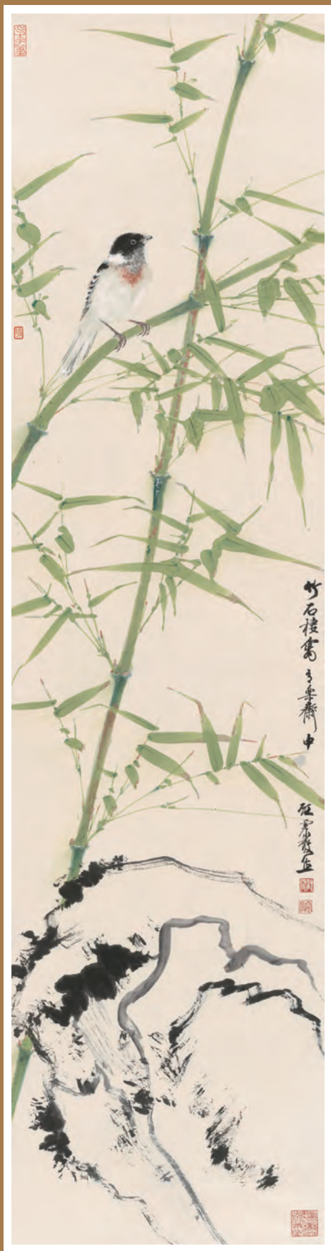
《竹石栖禽》 顾震岩（杭州盟员）