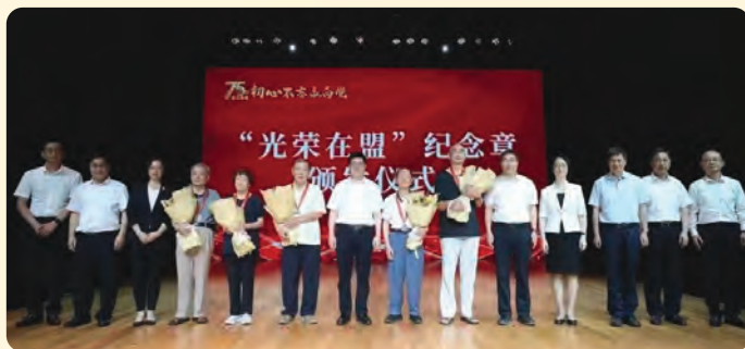
▲大会举行了“光荣在盟”纪念章颁发仪式