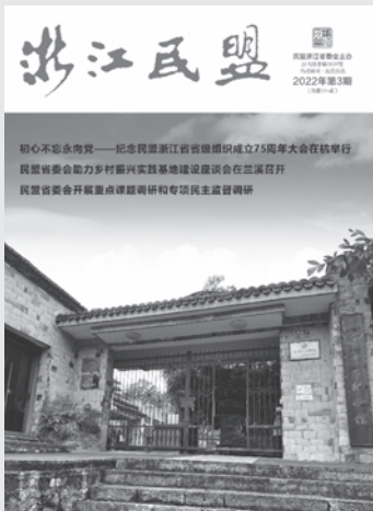
封面：吴萑之纪念馆