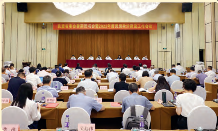
◀8月27日，民盟省委会暑期读书会暨2022年度思想政治建设工作会议在杭召开。