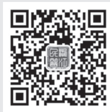
“浙江民盟”微信公众号