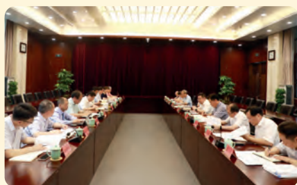
▲7月25日，副省长、民盟省委主委成岳冲赴省农业农村厅开展“空心村”整治振兴专项民主监督调研。