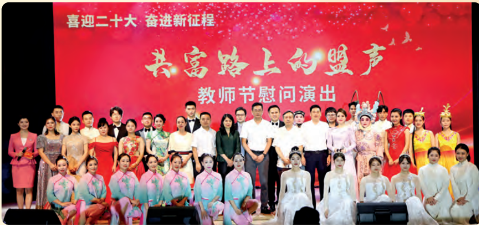
▲9月8日，民盟省委会举行“共富路上的盟声”教师节慰问演出。