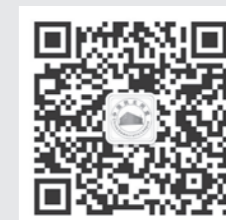
“中国民主同盟”微信公众号