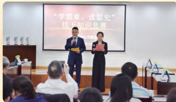
▲民盟舟山市委会举行“学盟章、读盟史”线下知识竞赛。