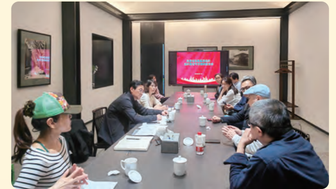
▲ 4月12日，省直工委启动开展省直属基层组织建设专项调研。