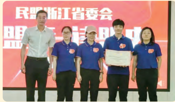
▲6月11日，民盟省委会“学盟章、读盟史”知识竞赛线下PK赛决赛举办。