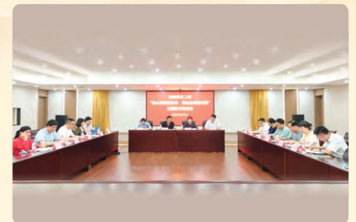
▲ 6月25日，民盟省直工委召开“凝心铸魂强根基、团结奋进新征程”主题教育推进会。