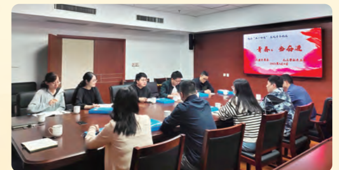
▲5月4日，为纪念“五一口号”发布75周年，重温“五四”精神，民盟舟山市青年委联合九三学社青工委开展“青春，当奋斗”主题活动。