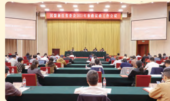
▲ 5月10日，民盟省委会2023年参政议政工作会议在杭州召开。