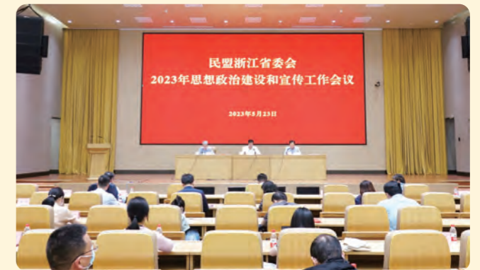
▲ 5月23日，民盟省委会2023年思想政治建设和宣传工作会议召开。