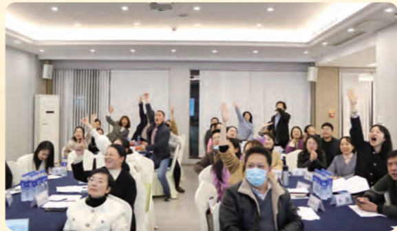
▲民盟金华市委会组织开展“学盟章、读盟史”知识竞赛。