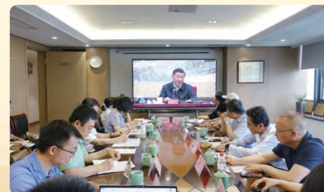
▲ 6月5日，民盟省委会召开“推进高质量教育体系建设专题讨论会”。