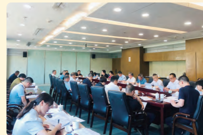
▲ 5月29日，民盟丽水市委会召开“凝心铸魂强根基、团结奋进新征程”主题教育动员部署会。