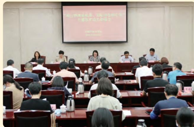
▲ 5月31日，民盟宁波市委会召开“凝心铸魂强根基、团结奋进新征程”主题教育动员部署会。