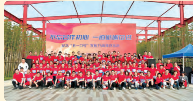
▲4月15日，民盟宁波市委举办不忘合作初心一道砥砺前行——纪念“五一口号”发布75周年欢乐跑活动。