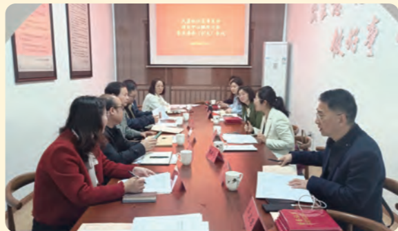
▲民盟椒江区委会举办“学盟章、读盟史”暨纪念“五一口号”75周年活动。