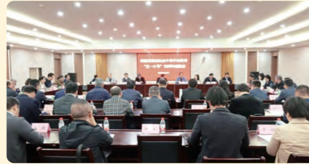
▲4月23日，民盟省委会纪念中共中央发布“五一口号”75周年座谈会召开。