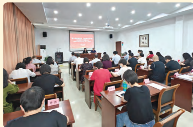
▲ 6月14日上午，民盟嘉兴市委会召开“凝心铸魂强根基、团结奋进新征程”主题教育动员部署会暨领导班子理论学习中心组（扩大）学习会。