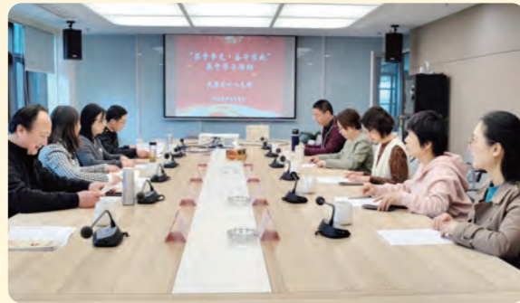
▲民盟吴兴区二支部通过领学盟章、讲述民盟先贤故事等形式开展了“学盟章、读盟史”活动。