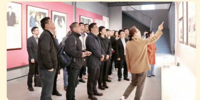
▲4月24日，民盟湖州市委会组织近三年入盟新盟员开展纪念“五一口号”发布75周年“走基地、悟初心”活动，参观学习浙江民盟盟史馆。