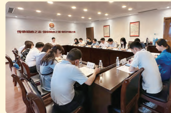
▲ 6月13日，民盟衢州市委会召开“凝心铸魂强根基、团结奋进新征程”主题教育动员部署会。