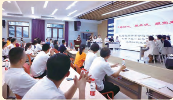
▲民盟杭州市委会举行“铭初心，聚共识，跟党走”主题知识竞赛决赛。