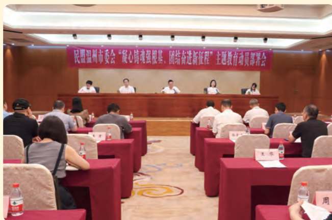
▲ 6月21日上午，民盟温州市委会召开“凝心铸魂强根基、团结奋进新征程”主题教育动员部署会。