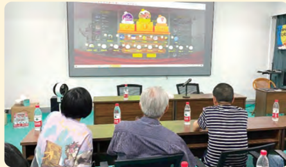
▲民盟宁海县基层委员会依托盟员自行制作的微信小程序，通过线上答题形式开展“学盟章、读盟史”知识竞赛活动。