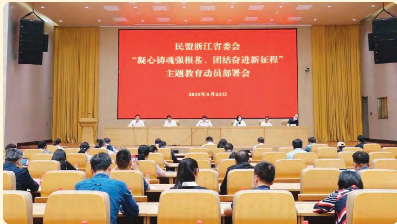
◀ 5月23日，民盟浙江省委“凝心铸魂强根基、团结奋进新征程”主题教育动员部署会以线下和线上结合形式召开。