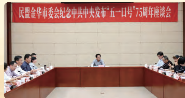
▲4月22日，民盟金华市委会召开纪念中共中央发布“五一口号”75周年座谈会。