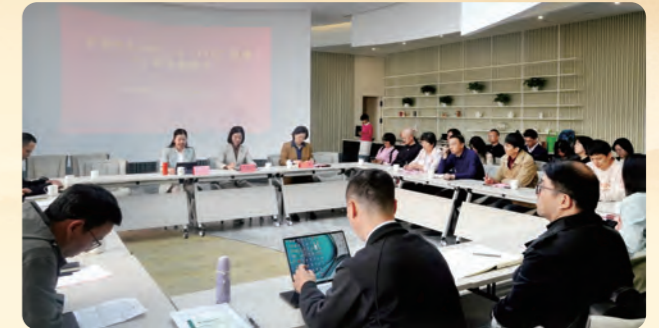
▲4月27日，民盟温州市委会举办纪念中共中央“五一口号”发布75周年座谈会。