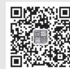
“浙江民盟”微信公众号