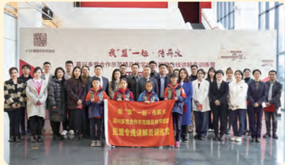
▲民盟嘉兴市委举办“我盟一起传薪火”多党合作示范精品教学线路民盟专线讲解员训练营。