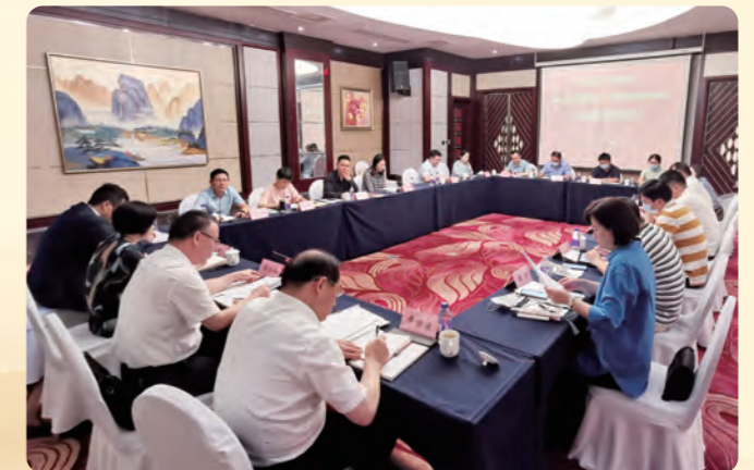
▲ 6月10日，民盟舟山市委会召开“凝心铸魂强根基、团结奋进新征程”主题教育动员部署会。