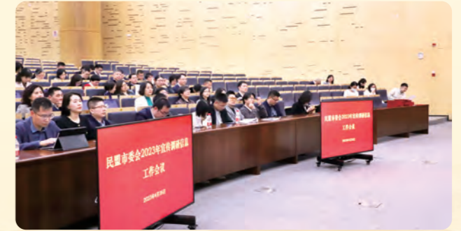
▲4月26日，民盟杭州市委会举行宣传调研信息工作会议暨纪念中共中央发布“五一口号”75周年主题知识竞赛。