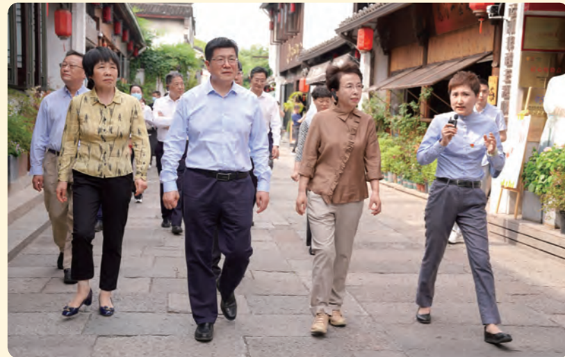
◀ 5月16日至17日，全国政协常委、民盟中央副主席、北京市政协副主席、民盟北京市委主委程红率北京民盟调研组来浙开展专题调研。