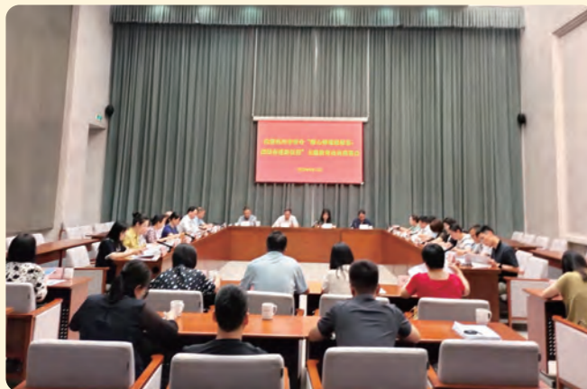
▲ 6月13日，民盟杭州市委会召开“凝心铸魂强根基、团结奋进新征程”主题教育动员部署会。