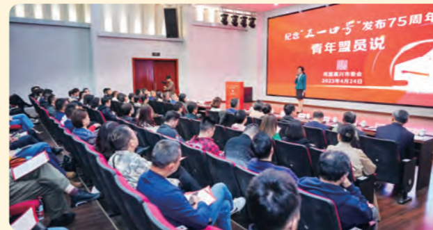
▲4月25日，民盟嘉兴市委举行“纪念‘五一口号’发布75周年青盟说”活动。