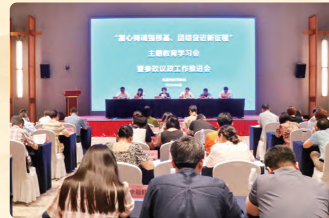
▲ 6月26日至27日，民盟湖州市委会召开“凝心铸魂强根基、团结奋进新征程”主题教育学习会暨参政议政工作推进会。