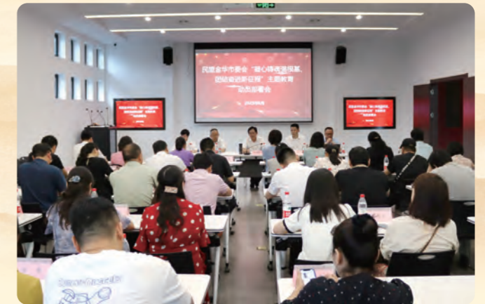
▲ 6月21日，民盟金华市委会在义乌陈望道故居召开“凝心铸魂强根基、团结奋进新征程”主题教育动员部署会。