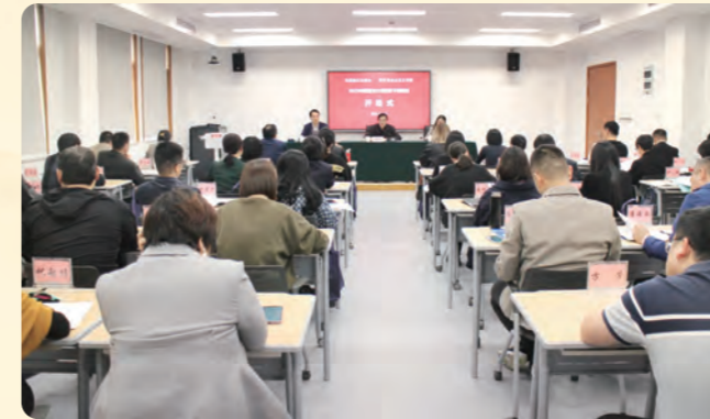
▲ 4月11日，民盟省委会文化领域骨干培训班在杭州举办。