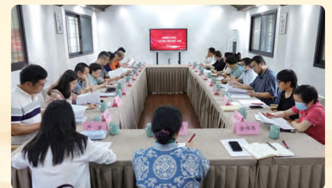
▲ 6月9日，民盟省委会举行“之江同心·盟声议政”沙龙，专题学习习近平总书记在文化传承发展座谈会上的重要讲话精神。