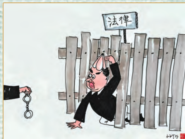
▲钻法律空子的后果