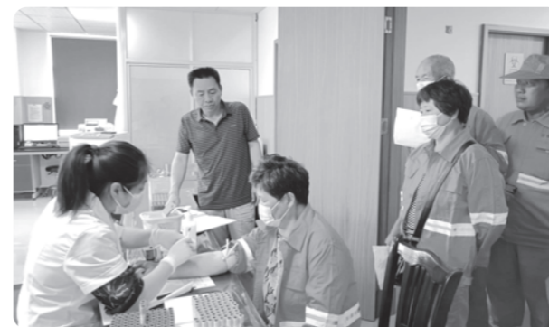
▲金华东阳市委会健康礼赠“公路天使”

6月7日，农工党越城区基层委组织党员在香莲公寓举行了“环境与健康宣传周”主题宣传活动，为群众进行义诊、健康咨询、健康知识宣传等社会服务，将优质、暖心的服务送到群众身边。