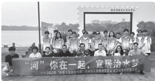
▲衢州市委会、衢州学院支部联合开展“‘河’你在一起，宜居治水梦”活动

同时，党员专家还为演员和村民们进行了心肺复苏救护知识培训，教授了心血管常见疾病健康急救知识，增强了大家的自救互救的能力。