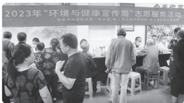
▲台州农工党组织联合中共黄岩统战部第一支部开展“环境与健康宣传周”志愿服务活动

活动中，党员们参加了六五世界环境日主题宣传活动暨“美丽舟山·秀山行”启动仪式，还参观了岱山县生态建设成就展、秀山乡生态修复工程“泥乡花海”和农村生活污水处理终端，并在秀山乡生态林修复基地进行了植树活动。