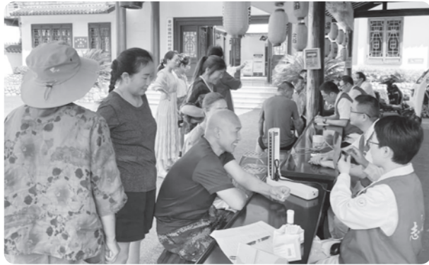
▲湖州市委会在“环境与健康宣传周”活动中为“非遗”演员体检

6月9日上午，农工党湖州市委会组织县医疗专家党员赴安吉县章村镇郎村开展“护航非遗点亮长城，章村健康服务行”活动，为当地“响木舞”演员及村民进行健康体检咨询。