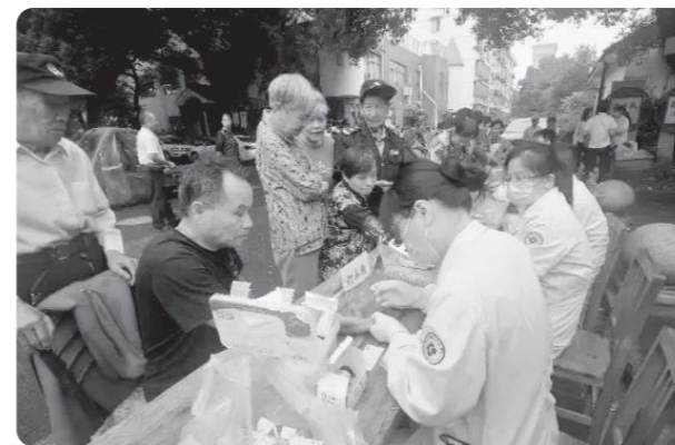
▲绍兴市越城区基层委开展“环境与健康宣传周”宣传活动

在座谈会上，党员们围绕“提升污水收集处置能力，改善城市水环境质量”主题，就排水管网建设更新改造、污水收集处置能力提升等方面与市排水公司进行探讨交流，针对全市排水存在的问题和困难提出意见建议。