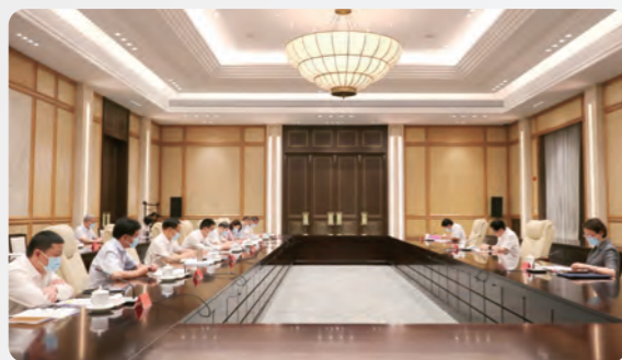
▲领导班子和代表人士队伍建设调研座谈会

6月10日-11日，全国人大常委会副委员长、农工党中央主席何维带队赴杭州调研，先后召开领导班子和代表人士队伍建设调研座谈会、新材料科学发展与技术研发专家座谈会。农工党中央专职副主席兼秘书长、组织部部长邓蓉玲陪同调研。