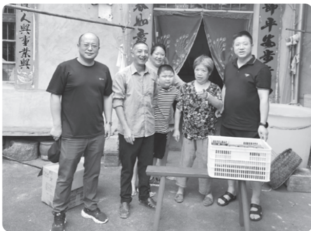
▲帮助低收入农户销售土蜂蜜

“2021年7月，省应急管理厅人事处找我谈话，打算选派我去省厅的结对帮扶点——龙泉担任农村