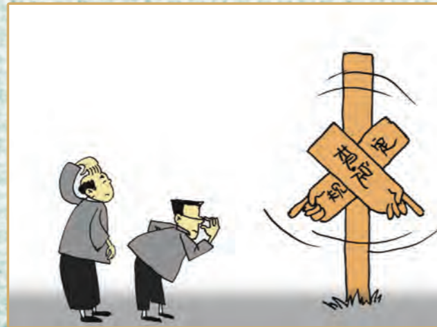
▲规定不能“摇摆不定”