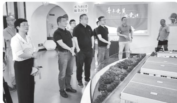
▲温州市委会开展2023年“环境与健康宣传周”系列活动

活动现场展示了“八八战略”引领下，美丽宁波建设成效、青山金山“双向奔赴”的典型案例等内容，以引导全市市民形成参与美丽宁波建设的浓厚氛围；推出了“忠实践行‘八八战略’，奋力打造‘美丽宁波’”等主题展，设立了环保集市，倡导以竹代塑环保理念，吸引众多村民参与其中。