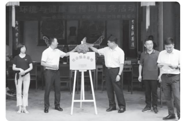
▲丽水市委会、莲都区委“同心共富”社会服务基地在太平乡揭牌

揭牌当日，丽水市委会整合市、区两级组织的资源，发挥党员专业特长，共组织农工党丽水市中