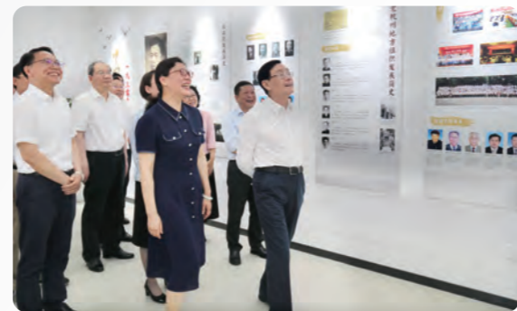
▲参观考察杭州上城党员之家