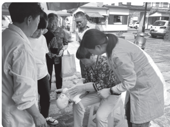
▲杭州市委会开展“环境与健康宣传周”为民服务活动

连日来，根据农工党中央工作安排，农工党浙江省全省各级组织结合自身实际，精心筹备和组织，通过多种形式开展农工党2023年“环境与健康宣传周”活动，推动环境与健康知识进社区、进农村、进校园，反响强烈，获得广泛好评。