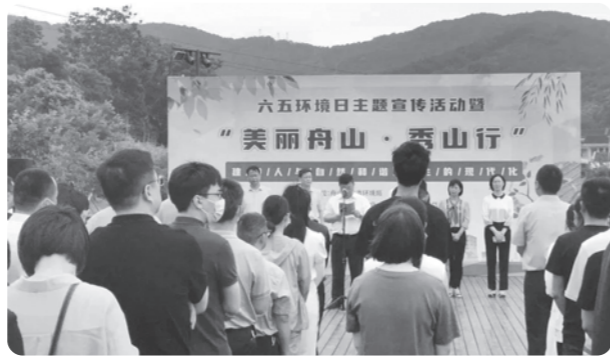
▲舟山市委会参加世界环境日秀山行活动

合开展了“‘河’你在一起，宜居治水梦”——2023年“环境与健康宣传周”活动。本次活动共分两个阶段，第一阶段为“巡湖清洁和水质采样活动”，在衢州学院东门外信安湖边共同开展巡湖清洁和水质采样活动，第二阶段为“五水共治问卷调查活动”，了解衢州市民对五水共治的认识，呼吁广大群众关注水治理、珍惜水资源、呵护水环境。