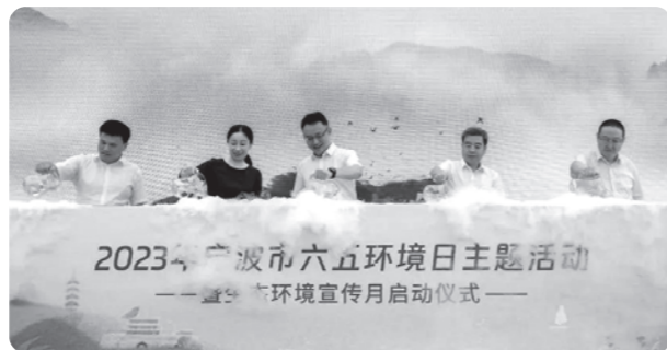
▲宁波市委联合主办2023年宁波市六五环境日主题活动

近日，农工党杭州市委会助力共同富裕社会服务基地·富阳区基层委医疗健康服务站在场口镇开展2023年“环境与健康宣传周”为民服务活动。农工党医疗专家为专程赶来的群众和患者，提供健康义诊和医疗咨询服务，就眼科、疼痛科、妇产科、中医康复科、皮肤科、消化内科、普外科、肾内科等方面的问题进行诊疗和专业解答。救护培训专家为场口镇网格员及安全巡防员进行急救知识培训。