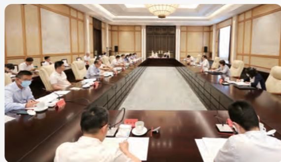
▲新材料科学发展与技术研发专家座谈会