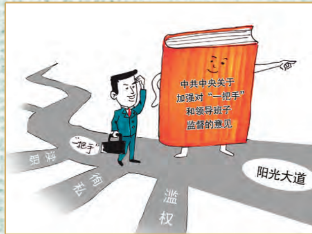
▲为一把手指明道路