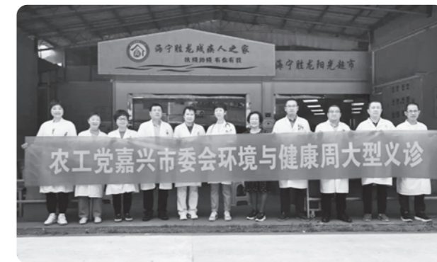
▲嘉兴市县两级组织分别开展“环境与健康宣传周”活动

近日，农工党嘉兴市委联合嘉兴市第一医院总院在海宁市黄湾镇闸口村开展“环境与健康”宣传周主题大型义诊活动，为附近的村民群众送去医疗义诊服务。全国人大代表、农工党嘉兴市委副主委张齐参加活动。