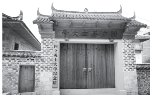
▲ 位于温州泰顺的国立英士大学纪念馆

英士大学在抗日烽火中诞生，在颠沛流离中坚守，在艰难困苦中生存，体现了中华民族永不屈服的气节和风骨。在这里，淬炼了一大批于民族危亡中风雨前行的国之英才，也曾诞生了一个民主党派