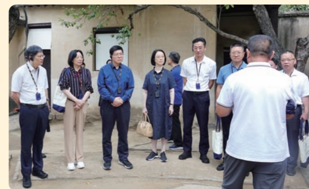
▲7月20日，民盟省委会赴西柏坡开展“凝心铸魂强根基、团结奋进新征程”主题教育现场活动。