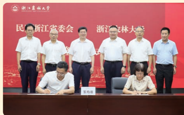
▲7月14日，民盟省委会与浙江农林大学举行合作协议签约及捐赠仪式。