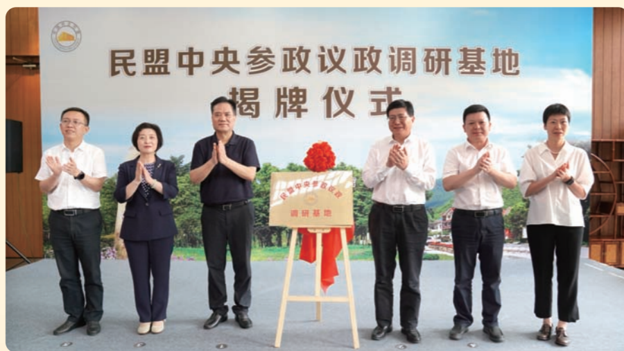
▶7月10日，全国人大常委会委员、民盟中央副主席张道宏出席民盟中央参政议政（浙江省安吉县）调研基地揭牌仪式。