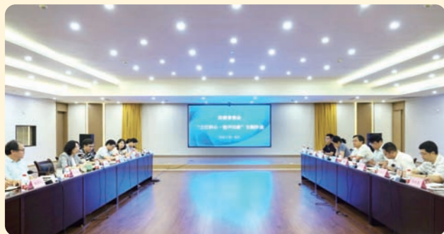
▲7月29日，民盟省委会“之江同心·盟声议政”主题沙龙在杭州召开。