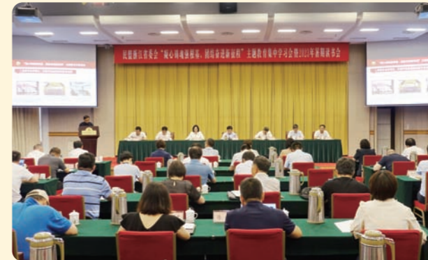
▲8月11日，民盟省委会“凝心铸魂强根基、团结奋进新征程”主题教育集中学习会暨2023年暑期读书会在杭召开。