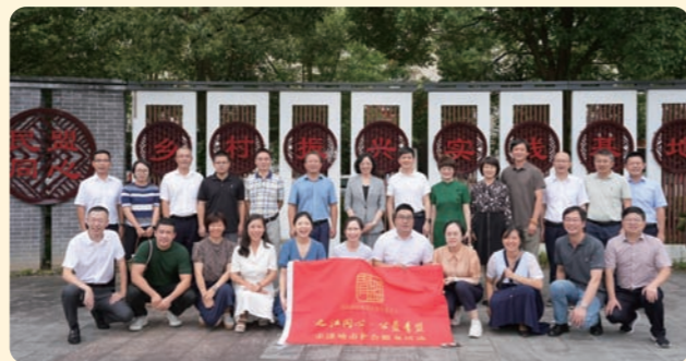
▲8月26日，民盟省委会青年委开展“之江同心·公益青盟”走进衢州社会服务活动。