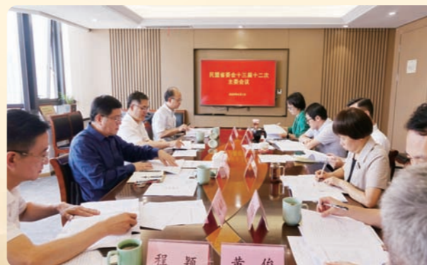
▲9月1日，民盟省委会学习《汇聚磅礴力量 同心勇立潮头——习近平同志在浙江工作期间关于统战工作的探索与实践》专题纪实文章。