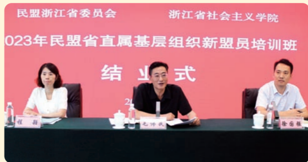
▲7月12日至14日，2023年民盟浙江省直属基层组织新盟员培训班在浙江省社会主义学院举行。