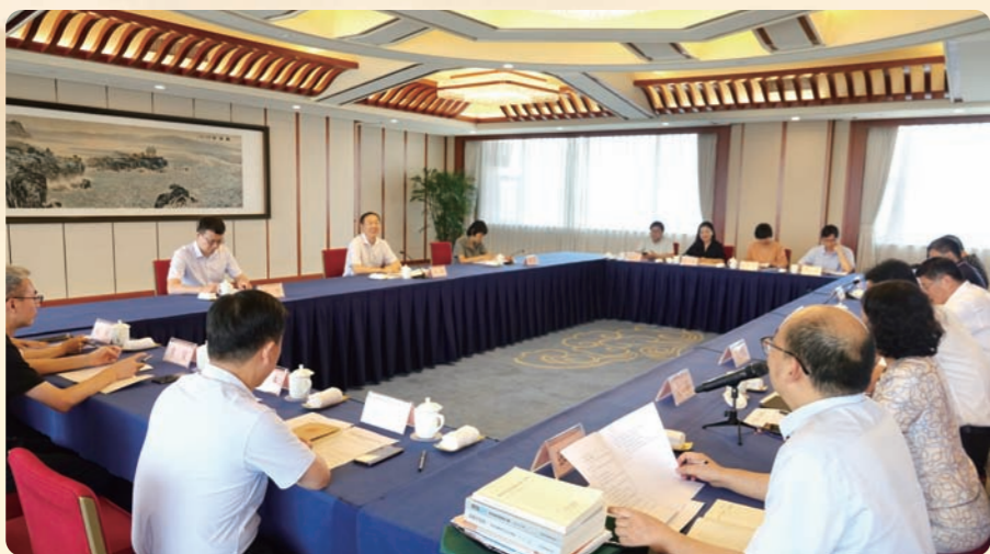
◀8月8日，全国人大常委会委员、民盟中央副主席徐辉率队赴浙江调研“凝心铸魂强根基、团结奋进新征程”主题教育开展情况。