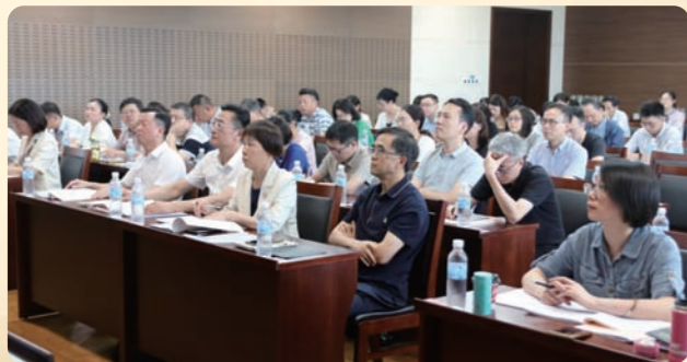
▲9月6日，2023年全省民盟机关专职干部能力提升培训班在宁波举办。