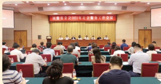
▲9月21日，民盟省委会2023年社会服务工作会议在杭州召开。