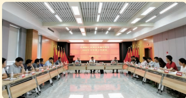
▲7月9日，民盟省委会金融专委会举行半年度工作会议暨盟声议政金融沙龙。