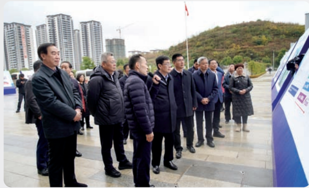
▲11月29日至12月1日，全国人大常委会副委员长、农工党中央主席何维率队赴贵州进行定点帮扶专题调研。省委会主委葛明华陪同调研并参加座谈会。