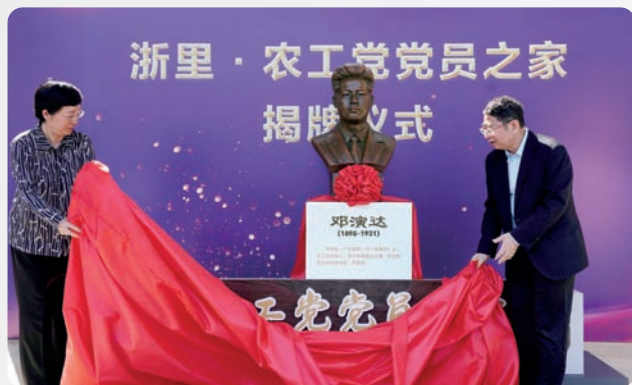
▲11月5日，农工党中央专职副主席王路、副主席焦红在杭州贝莱庄园为省委会以“3+1”模式联动杭州市委会、余杭区基层委，携手贝达药业探索建设的“浙里·农工党党员之家”揭牌。