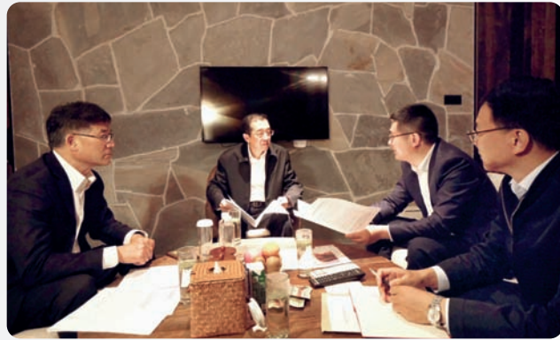
▲10月22日，全国政协副主席、农工党中央常务副主席杨震在丽水出席中国仙都祭祀轩辕黄帝大典期间，利用晚上时间接见了省委会、丽水市委会领导班子部分成员。