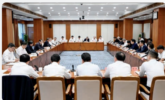
▲10月26日，中共浙江省委副书记易炼红主持召开各民主党派省委会、省工商联负责人和无党派人士代表座谈会。省委会主委葛明华在会上发言。