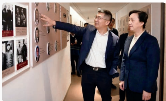
▲11月29日，省委常委、统战部部长王文序走访各民主党派省委会、省工商联，与各民主党派省委会、省工商联领导班子成员及机关干部亲切交流。