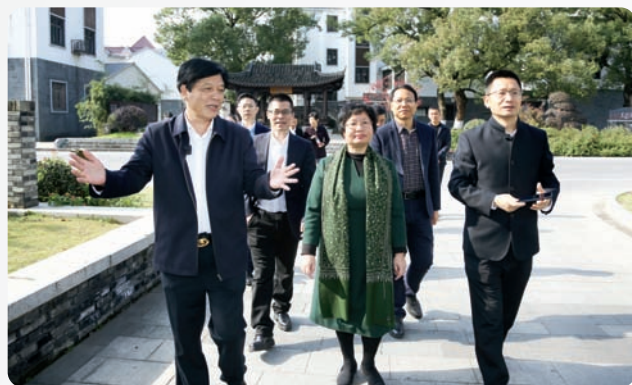
▲11月25日至26日，农工党中央副主席、全国人大环境与资源保护委员会副主任吕忠梅带领农工党中央社会法治与联络专委会到浙江开展“枫桥经验”经典案例调研活动。