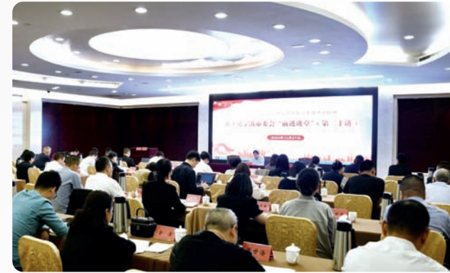
▲10月27日，宁波市委举办“前进讲堂”，省委会副主委、宁波市委主委陈为能宣讲习近平总书记考察浙江重要讲话精神。