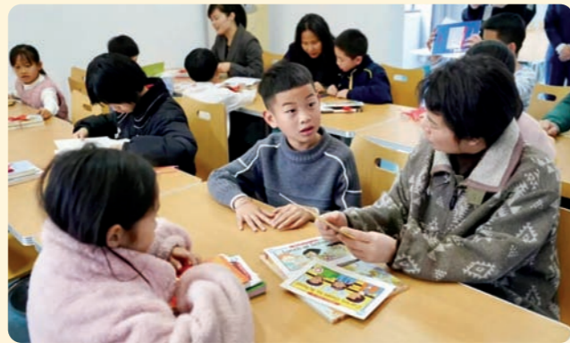
▲3月15日，民盟淳安县第三支部在淳安县庄天岭家园社区活动中心举办“鸿雁齐飞 悦读起步”关爱安居优教儿童暖心行动。