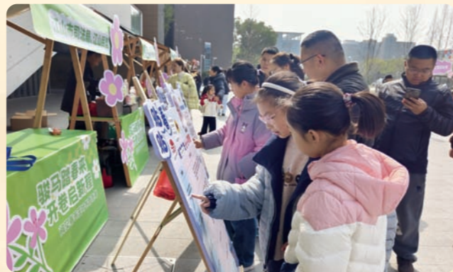
▲3月14日，民盟江山市总支开展“法治润童心 盟伴青春行”青少年普法活动。