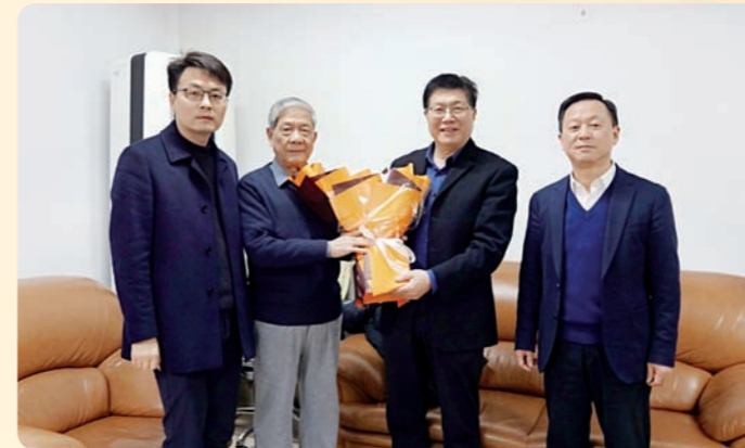
◀ 成岳冲主委带队走访慰问省委会老领导孙优贤。

走访中，班子成员详细了解老领导的身体和生活情况，向他们介绍了一年来省委会各项工作进展情况，表示浙江民盟各项事业发展离不开老领导打下的坚实基础，凝聚着各位领导的智慧、心血和汗水，并嘱咐老领导们多多保重身体，希望一如既往地关注支持民盟事业发展。