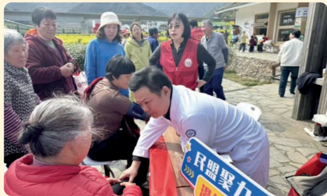
▲3月15日，民盟舟山市委会组织盟员志愿者走进定海区干览新建社区，开展“敬老助老暖香”主题社会服务活动。