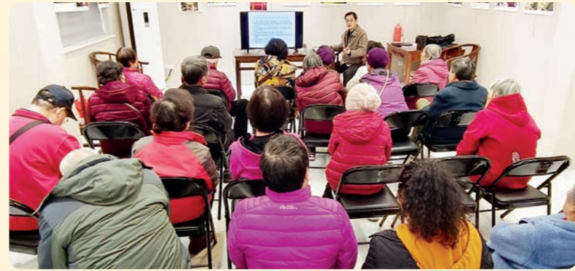
◀3月19日，由民盟宁波市委主办、童第周总支部承办的“盟暖邻里”社区服务活动在鄞州区白鹤街道丹凤社区开展。