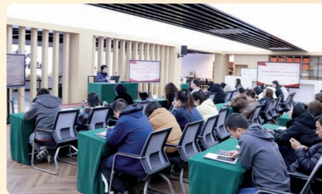
▲3月17日，民盟湖州市委会开展“校企融合赋新能之江同心促共富”——春季企业劳动就业专题活动。