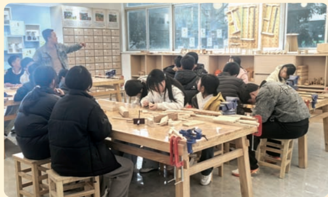
▲3月18日至19日，民盟嵊州市基层委员会在民盟省委助力乡村振兴实践基地谷来镇谷来二村开展“助力雏鹰展翅 民盟关爱护航”主题社会服务活动。