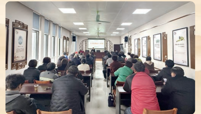
▲3月16日，“红枫健康大讲堂”中医养生公益课在民盟省委会助力乡村振兴实践基地嘉善县惠民街道枫南村温情开讲。