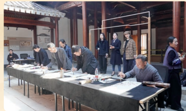
▲3月13日，民盟温州市委会在温州园博园举行“我为强城献翰墨”活动。