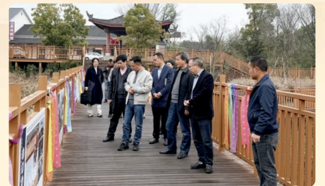
▲3月20日，民盟金华市委会赴兰溪市范院坞畲族村开展“三级联动·党盟合作”助推民族村共富实践暨“3·19”建盟日同心赋能行动。