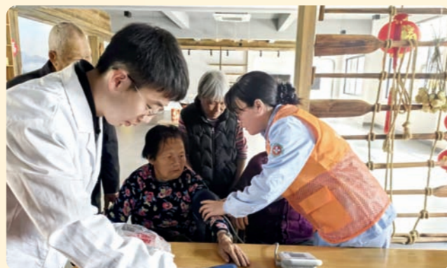
▲3月16日，民盟云和县基层委组织医疗骨干前往石浦村开展义诊。